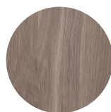
dark grey T